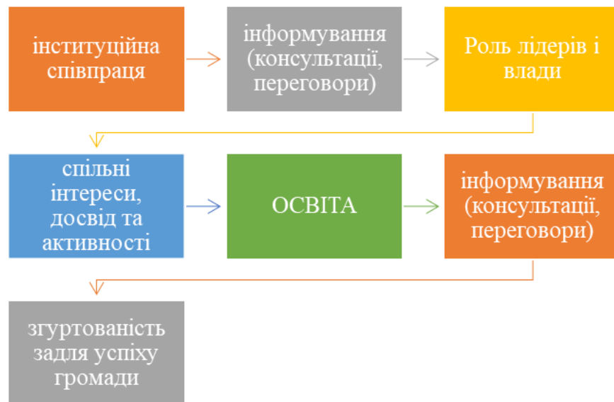
Рис1. Передумови соціальної згуртованості

Йдеться про інституційно оформлену співпрацю, метою якої є соціальна згуртованість. Така співпраця має ґрунтуватись на принципах: громадської активності, партнерства, відкритості та відповідальності, політичної незалежності. А також раціональному і збалансованому розвитку та комплексності, що притаманне соціальним інститутам, які виконують багато функцій, серед яких головне місце посідає регулятивна, до чого відноситься й соціальний діалог на ринку праці [рисунок 2].